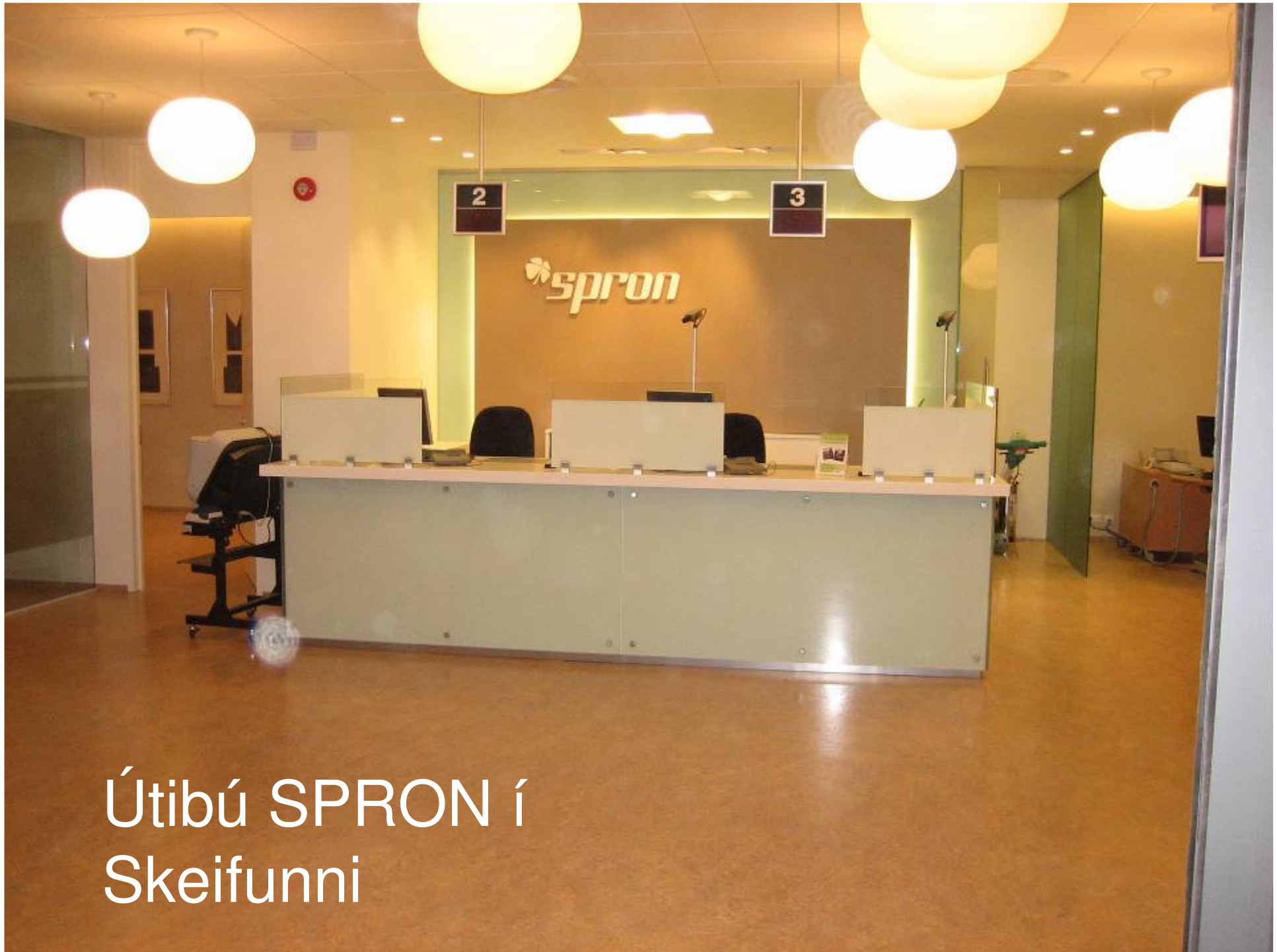
Útibú SPRON í Skeifunni